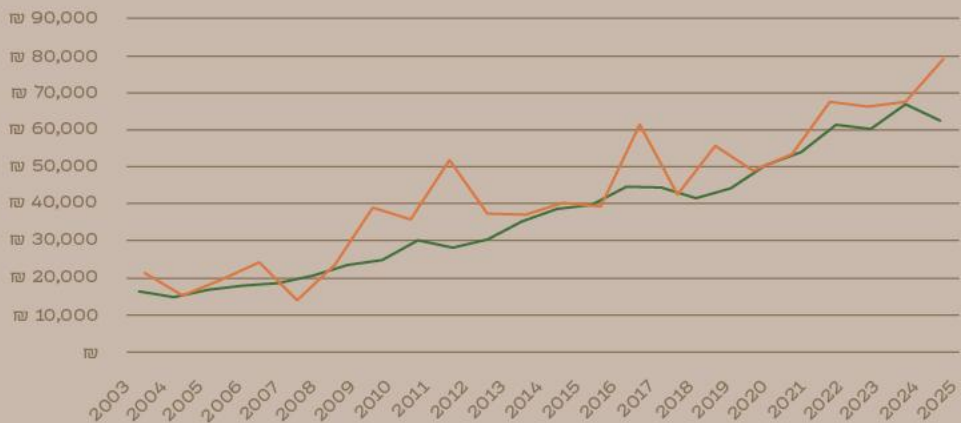
מחיר ממוצע למ"ר – קו החוף, מרכז העיר